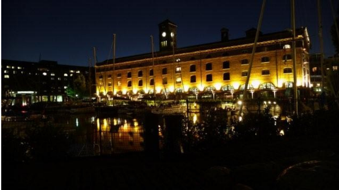
Nachts im St. Katherine Docks.